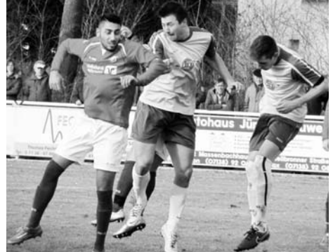
. . . und bleibt Sieger im folgenden Kopfballduell gegen die starken Union Angreifer!