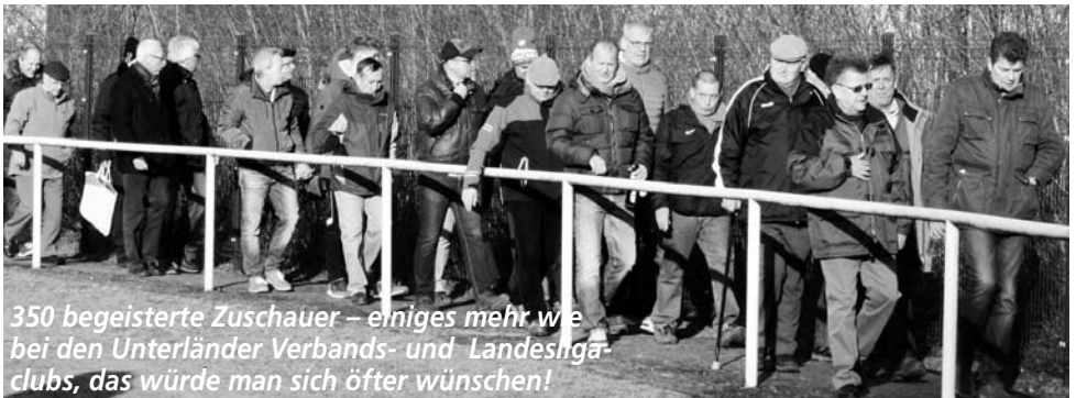
350 begeisterte Zuschauer – einiges mehr wie bei den Unterländer Verbands- und Landesligacups, das würde man sich öfter wünschen!