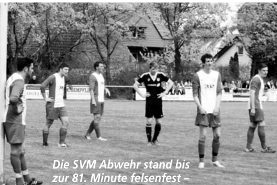
Die SVM Abwehr stand bis zur 81. Minute felsenfest –

konnte aber das „Duseltor des Jahres“ kurz vor dem Abpfiff nicht verhindern: Verlängerung und Elfmeterschießen!