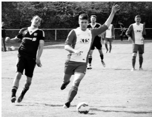
Harte und spannende Zweikämpfe prägten das dramatische und spannende Halbfinale unseres SVM gegen die Spfr. Lauffen im Bezirkspokal!