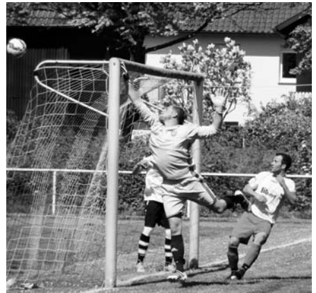
Mit einer Super Parade verhindert der Gästetorhüter einen weiteren SVM Treffer