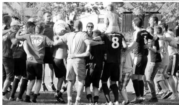
Erster Siegesjubiläum der noch jungen Runde und es wird garantiert nicht der letzte sein!