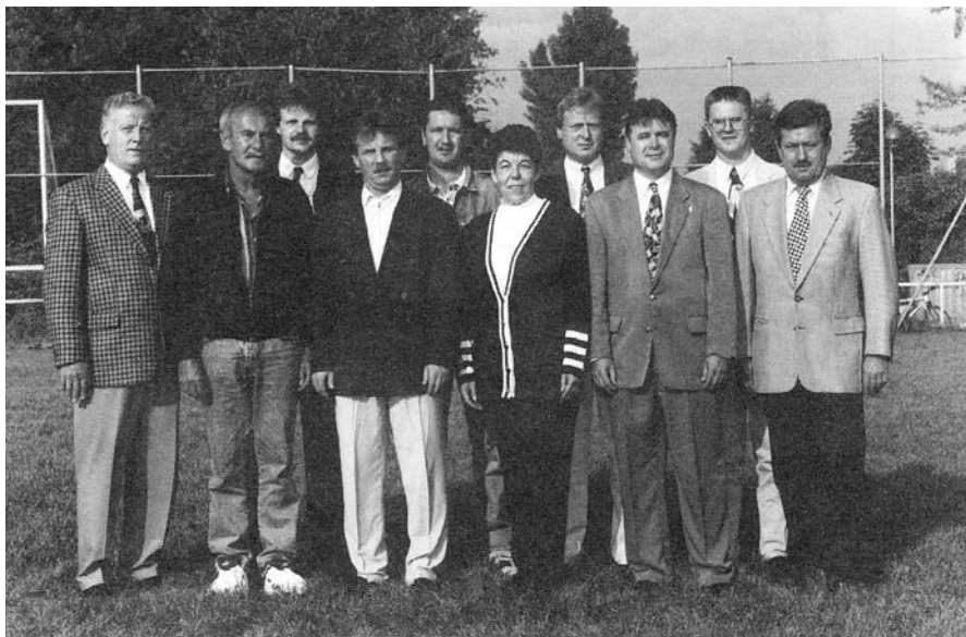
Vorstandschafft im Jahr 1995