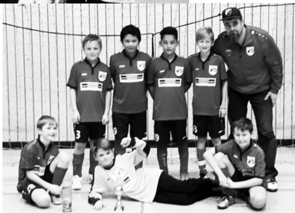
Siegerfoto aus Kirchardt