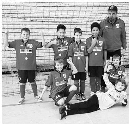
Siegerfoto vom Turnier in Bad Rappenau