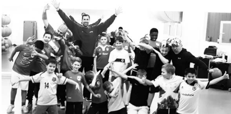
nach dem Training in der arena22