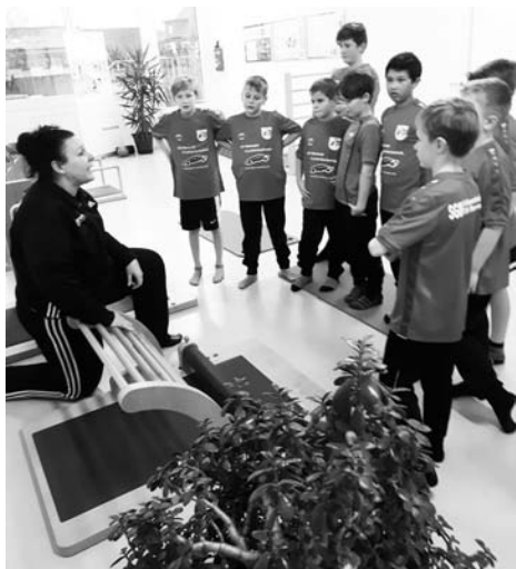
Training in der arena22 bei den five-geräten