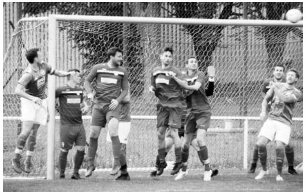
SGM Abwehrblock in Erwartung der nächsten Ecke – erfolgreich abgewehrt – gerade nochmal gut gegangen!