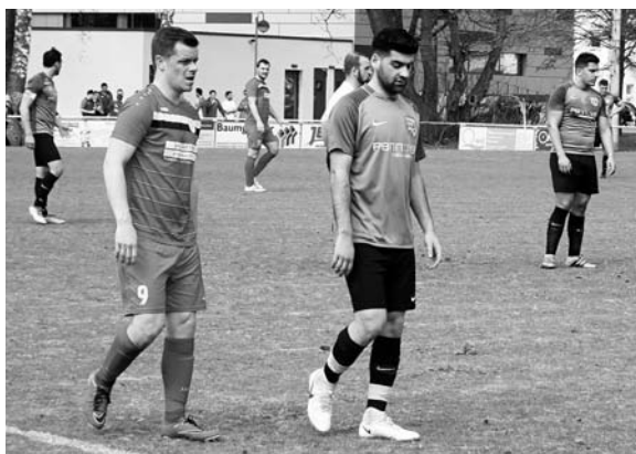
Unsere Jungs voll konzentriert bei der Sache, beim Gegner hängen die Köpfe schon etwas tiefer!