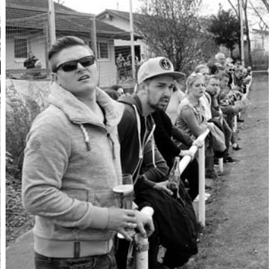
Tabellenstand hin – Tabellenstand her – wieder mal sehr guter Besuch beim SGM Heimspiel!