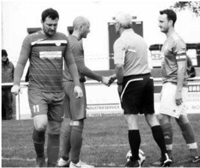
Die Mannschaftskapitäne werden von Schiri Reibel zur Platzwahl gebeten – gleich geht's los!