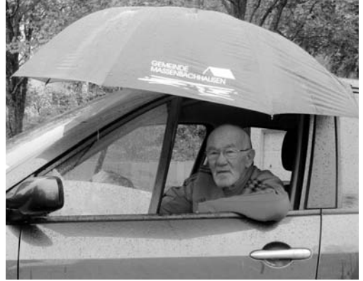
Gut beschirmt: Hauptsache nicht nass – "Zigeuner" Redakteur depe trocken im Auto!