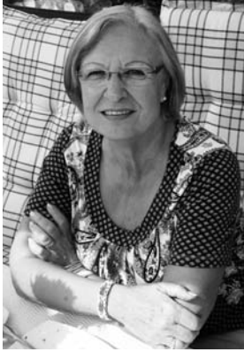
INGE BAUMANN FAN-CLUB SVM