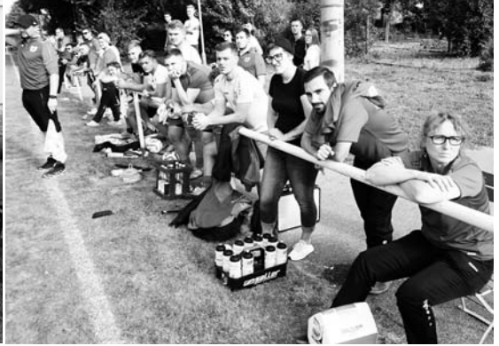
Gespannte Erwartung beim „Spitzentreff“ gegen das „Heide-Team“ auf der SGM Bank!