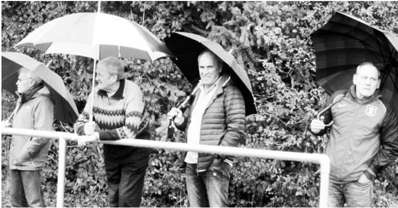
Gut beschirmt: Auch "gut beschirmt" schmeckt die Stadionwurst zum Bier bestens!