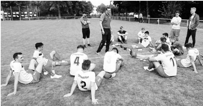
Halbzeit 2:1: "Baumes" hat schon zweimal geknipst, jetzt geht's zum Endspurt!